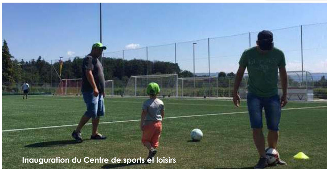
Inauguration du Centre de sports et loisirs