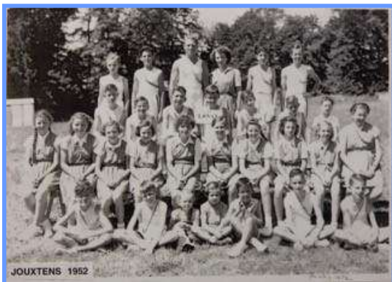
Les pupilles et pupillettes

La société de gymnastique fut fondée sur proposition de Jules Courtat, lors de la verrée qui suivait une répétition de chant de la Vigneronne.