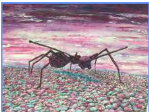
« La Fourmi » par Mme C. Senerchia

Sa présence a permis de soulager le personnel en place et notamment d'assurer la gestion de la déchèterie, en l'absence du titulaire.