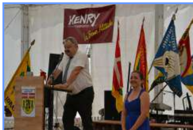
Le Conseil de l'Abbaye de Lonay