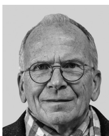
33. DUFLON Jean-Philippe 1956 - Photographe indépendant Rte d'Echandens 5